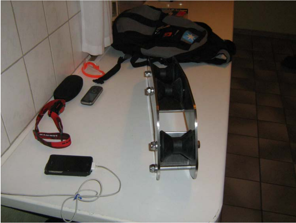
Rulle og anker – nu skal det bare være sommer så kan det monteres.