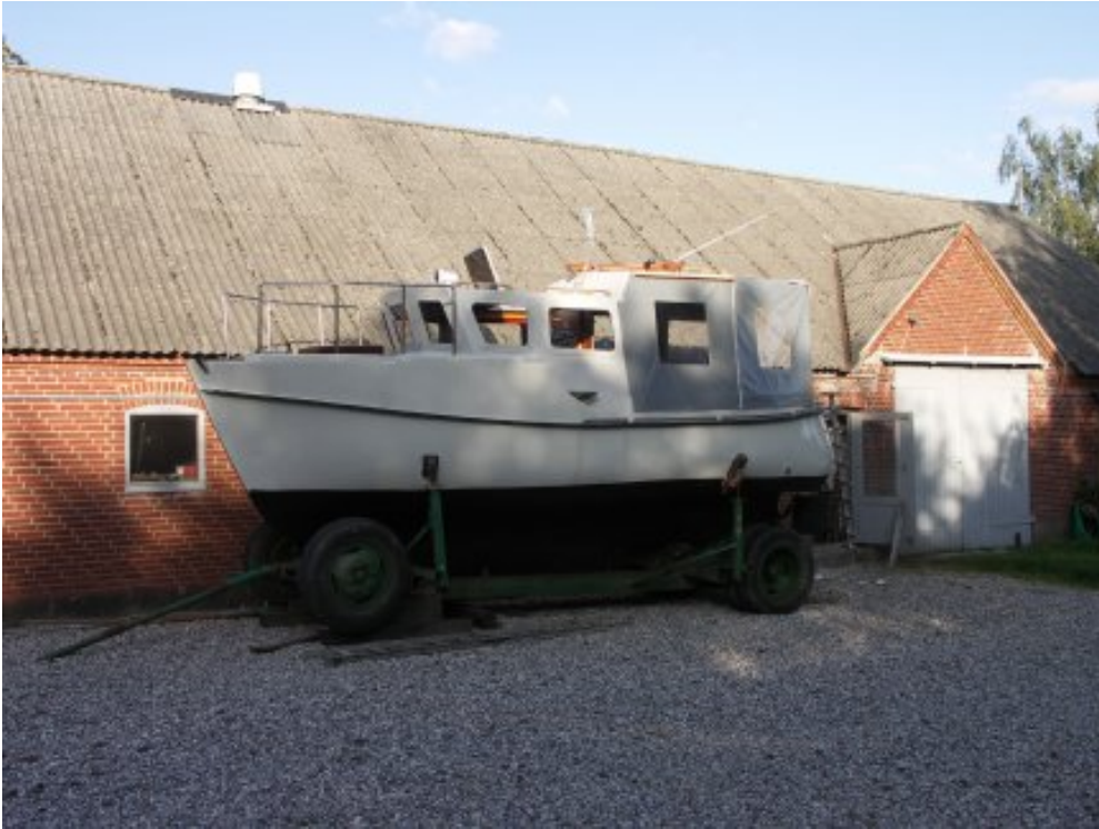
Var Arnold færdig